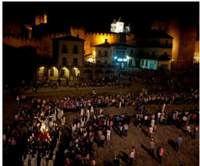
El hotel está en la Plaza Mayor y tiene una vista magnífica que me permitirá tomar fotos de la ciudad medieval y las procesiones