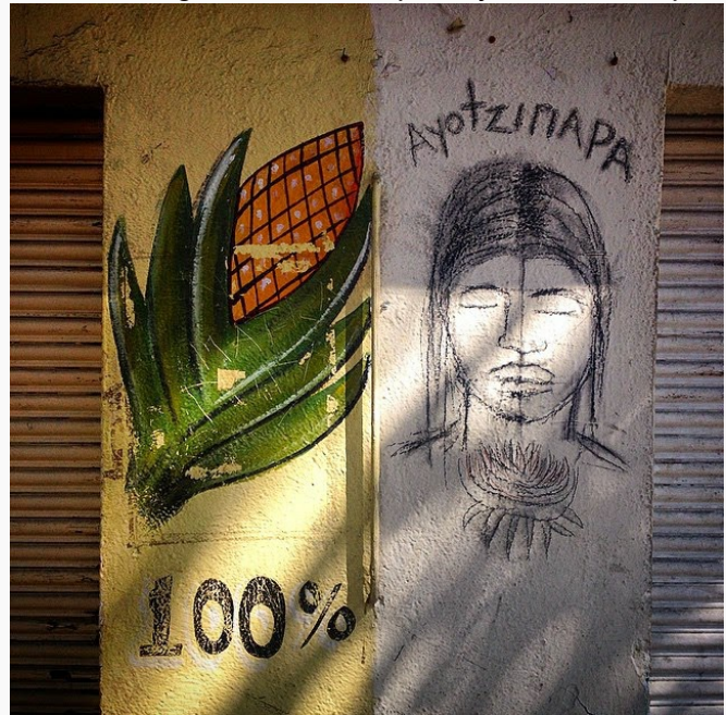
Sus descripciones hacen que comprenda porqué los periodistas que han estado en Guerrero dicen que la desaparición de los 43 estudiantes de Ayotzinapa es sólo la punta del iceberg.

Un rato después caminando junto a unos peregrinos que traen una enorme imagen de la Virgen de Guadalupe encuentro de nuevo a este joven entre la multitud.