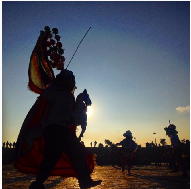
Unos danzantes aparecen bailando la danza de los Santiagos. En esta danza, un hombre disfrazado del Apostol Santiago, montado en un caballo blanco, persigue a los diablos hasta que los derrota.

Al entrar en una red social veo varios comentarios despectivos sobre las personas que van a la