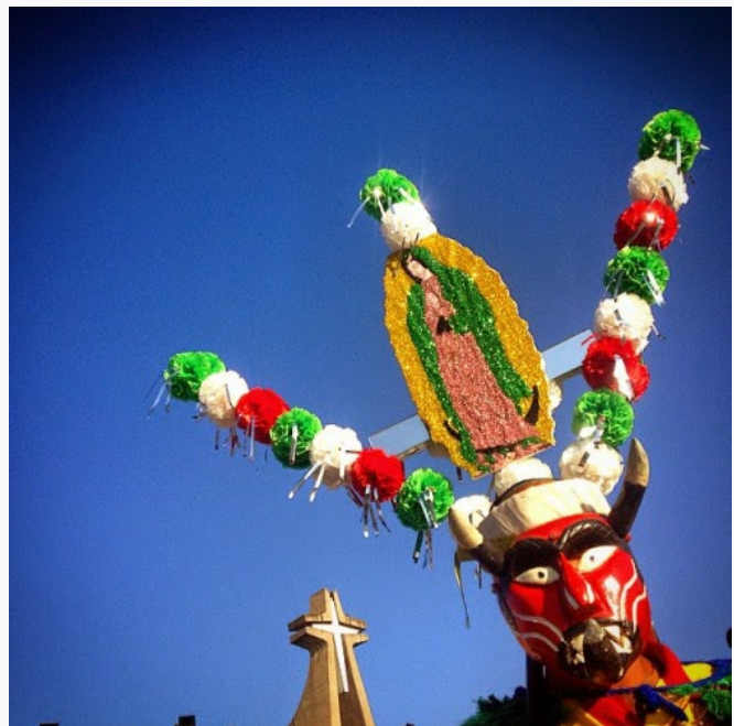
Entonces le explico que estas danzas son para enseñar a las personas que pueden superar a sus "demonios" y derrotarlos. Que tiene que confiar en que lo logrará. Tiene que poner a sus "demonios" de rodillas y hacer que le obedezcan.