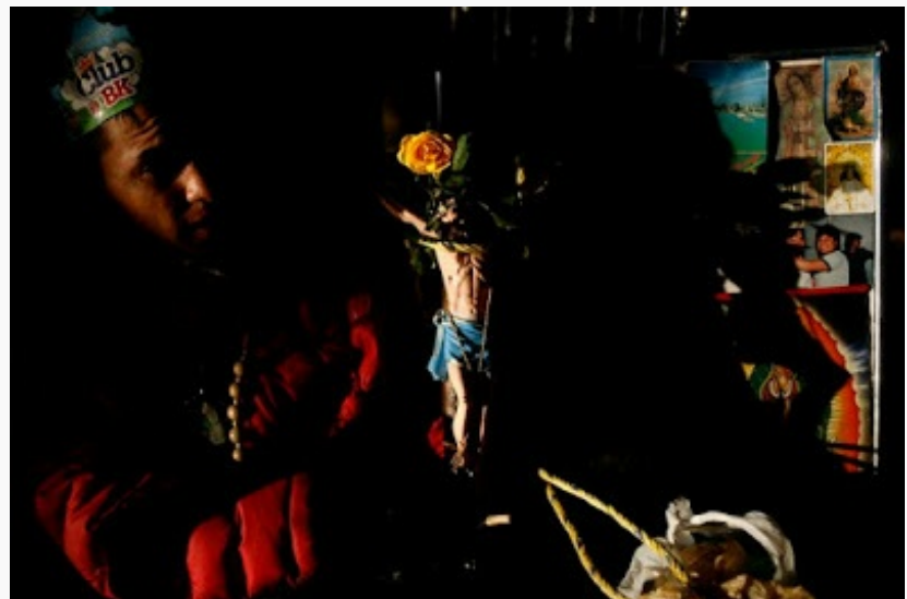
Señalando la cruz me dice que "es Dios" y que ha venido a pedirle a la virgen que le ayude a salir de su adicción