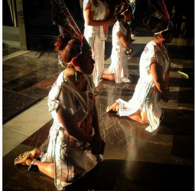
Una mujer comienza a pedir en voz alta a la Virgen de Guadalupe que los ayude, que la situación en Guerrero está muy mal y no tienen a quién acudir.

Creía que nunca vería tanta cantidad de gente en un sólo lugar. Sin embargo en estos siete años que he venido a la basílica he visto un despliegue de gente que no me lo puedo creer. Comparadas con esta peregrinación las manifestaciones políticas que vi tanto en Venezuela como en México son insignificantes. Y estas personas encima; ¡Vienen sin cobrar!